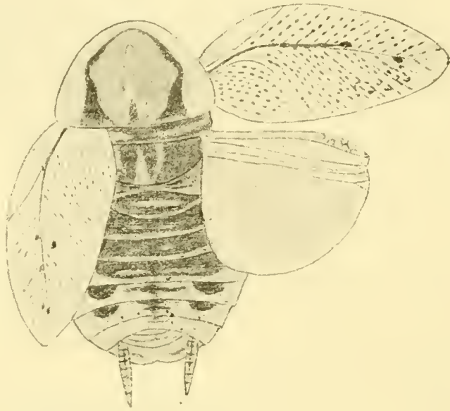
Fig. 4. Ect. lapponicus var. picta ADEL. ♀.

jusqu'à l'insertion des antennes, avec quelques taches brunes, sa partie supérieure d'un jaune clair avec une large bande transversale châtain ou roux-testacé entre les yeux; labre châtain à son extrémité, le dernier article des palpes maxillaires brun à son sommet; antennes roux-testacé, plus pâles à leur base.